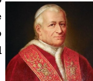
SS. Pío IX

“Esclavo de la Inmaculada u Operario en Ministerio, mis únicas ansias era ser religioso que hiciera voto de obediencia a los Sres. Obispos”. En su autobiografía IX: “Muy rara será la carta que yo haya escrito, mientras fui Operario, que no trate al principio o al fin, de mi amada Esclavitud y cuando yo no me llamaba Esclavo, sino Operario en Ministerio, no cambié más que de nombre; que al cabo, me dije, después de no pocas luchas, los nombres no hacen al caso. Esta correspondencia es evidente testimonio de que Dios no ha permitido en su infinita misericordia que yo cambie de vocación”