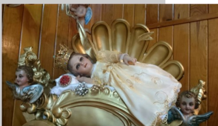
Capilla del Ajusco

De Dios esclava tú te confesaste; yo tu esclavo también hoy me confieso, por ser tú esclava de Jesús mandaste, por ser tu esclavo yo pido un beso.