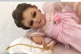
Juniorado Esclavos I. N.